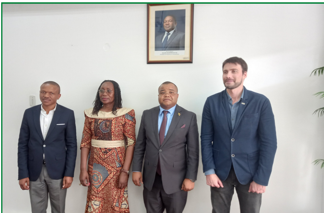
CONSELHO DE ADMINISTRAÇÃO DO CEDSIF,IP COM A PCA DA BMM E DIRECTOR DA COOPERAÇÃO TURCA

O Centro de Desenvolvimento de Sistemas de Informação de Finanças (CEDSIF, IP), está a desenvolver e operacionalizar a plataforma eletrónica para implementar o Sistema de Informação e Negociação de Mercadorias (SINEM) da Bolsa de Mercadorias de Moçambique (BMM)