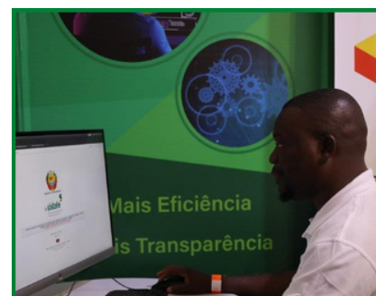
UTILIZADOR DO E-SISTAFE TRABALHANDO NO STAND DO CEDSIF,IP NA FACIM

No seu Stand, o CEDSIF, IP promoveu a sua imagem institucional e fez a divulgação dos seus serviços e produtos com enfoque para o Sistema de Admonistração Financeira do Estado (SISTAFE) e a sua plataforma eletrónica e-SISTAFE. O CEDSIF,IP disponibilizou ainda uma terminal de acesso ao e-SISTAFE aonde os utilizadores podiam aceder ao sistema e realizar as suas operações. (X)