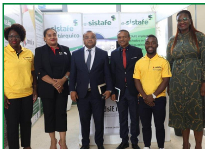
REPRESENTANTES DO CEDSIF,IP NA FIKANI