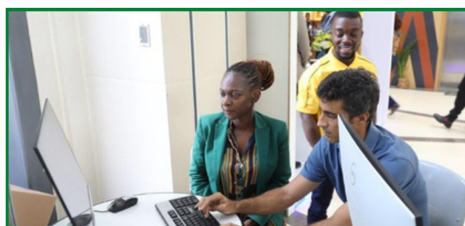
OPERADOR TURISTICO PROCEDENDO AO REGISTO DO SEU EMPREENDEIMENTO NO MRNT NO STAND DO CEDSIF,IP NA FIKANI

A 9ª Edição da FIKANI contou com a presença do Primeiro Ministro de Moçambique, Adriano Maleiane, entre outras individualidades e entidades e juntou 215 expositores provenientes da África do Sul, Zimbabwe e Eswatini, ligados a área de turismo e afins, distribuídos em 173 stands. (X)