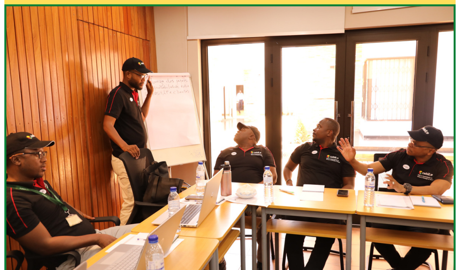
PARTICIPANTES DA 9ª RAQ EM SESSÃO DE TRABALHO