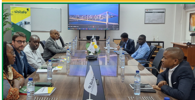
PORMENOR DO ENCONTRO COM A EQUIPA DO CEDSIF,IP