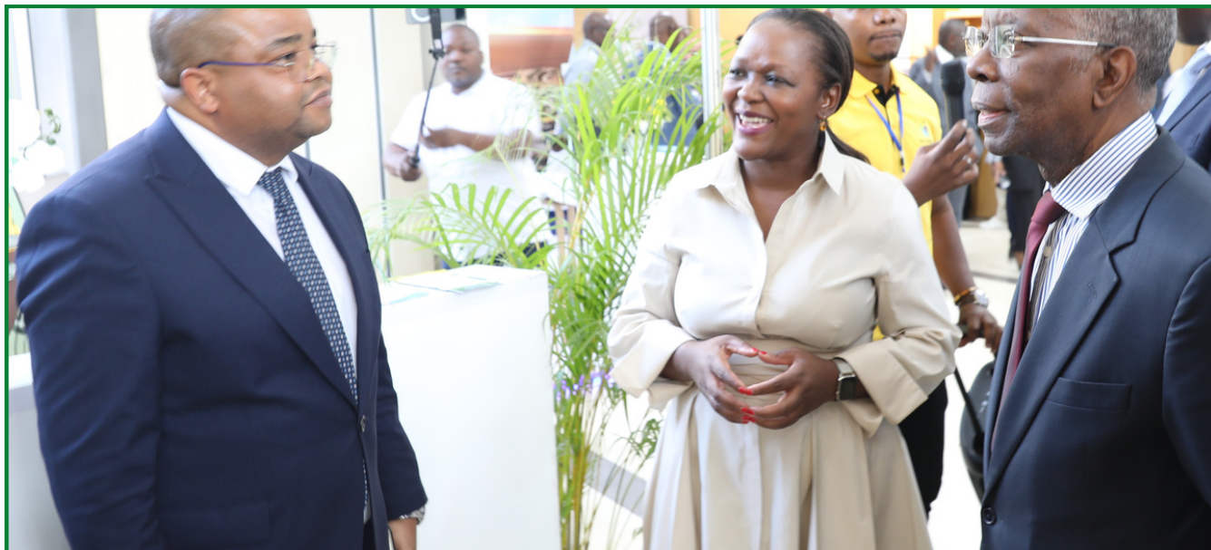
PCA DO CEDSIF, IP, MANUEL DOS SANTOS RECEBENDO O PRIMEIRO MINISTRO ADRIANO MALEIANE E A MINISTRA DA CULTURA E TURISMO, EDELVINA MATERULA NO STAND DO CEDSIF,IP NA FIKANI

O Centro de Desenvolvimento de Sistemas de Informação de Finanças (CEDSIF,IP), participou à convite do Ministério da Cultura e Turismo (MICULTUR) na 9ª