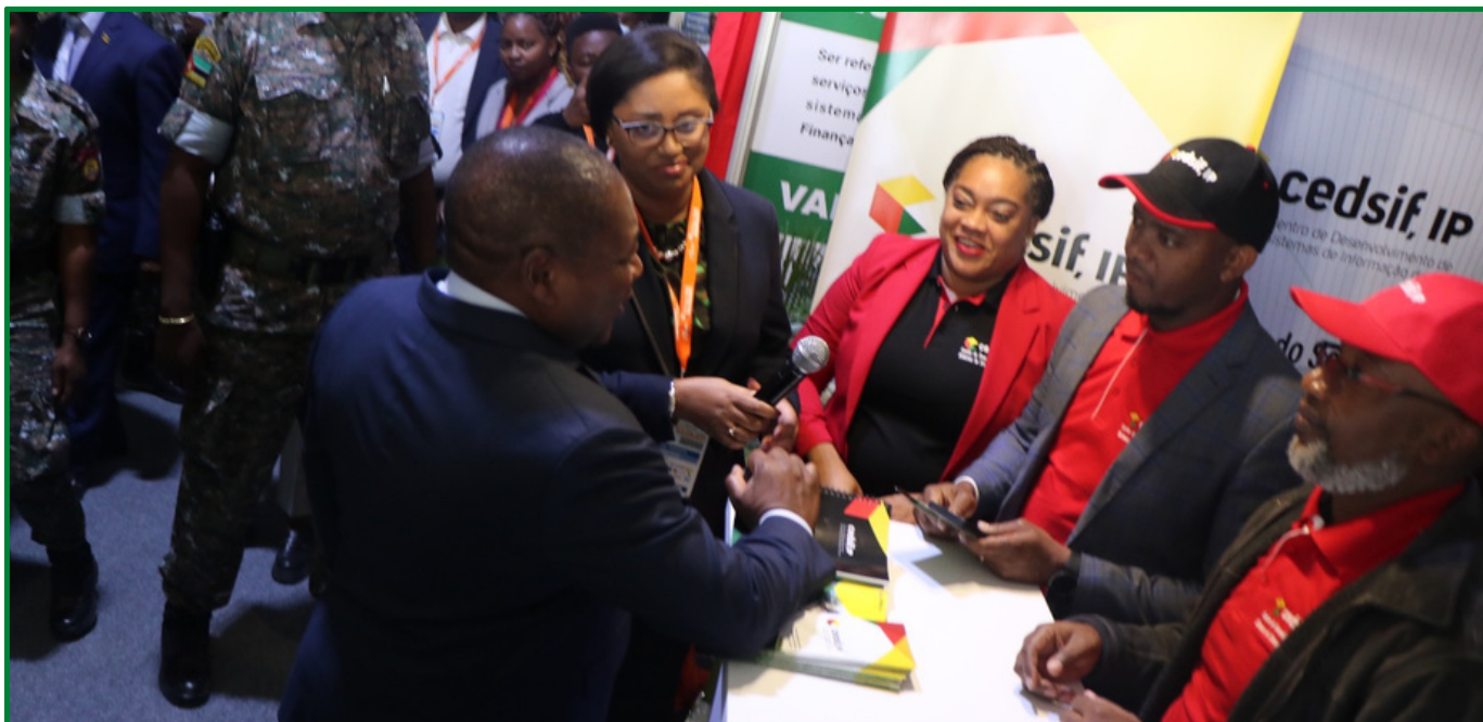
Presidente da República Filipe Jacinto Nyusi, em visita ao stand do CEDSIF,IP na FACIM