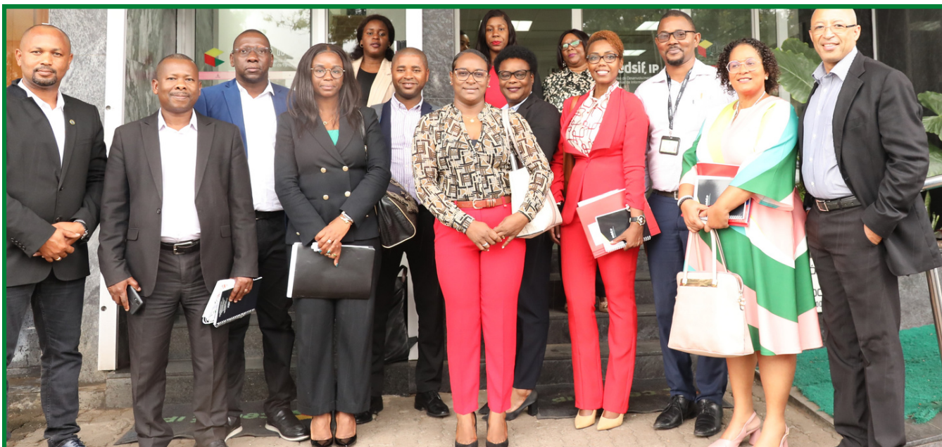
EQUIPA DO CEDSIF, IP EM FOTO DE FAMÍLIA COM MEMBROS DA DGPCP DE CABO VERDE, E DA DNPE

O Centro do Desenvolvimento de Sistemas de Informação de Finanças (CEDSIF,IP) recebeu uma Delegação composta pela Direção Geral do Património e de Contratação Pública (DGPCP) de Cabo Verde e a sua Congénere Moçambicana com o propósito da troca de Experiências em matéria de contratação pública com Moçambique.