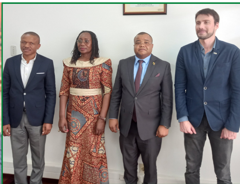
CEDSIF,IP RECEBE BMM - PAG.7