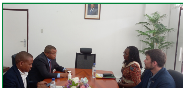
PORMENOR DA RECEPÇÃO DE CORTESIA PELO PCA DO CEDSIF,IP

A PCA da BMM manifestou ansiedade em ver materializadas as transacções internacionais, com importadores que possam, a partir dos seus países participar em leilões nacionais. (x)