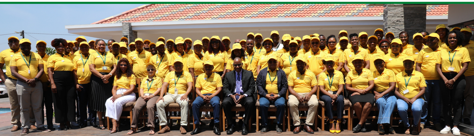
VICE-MINISTRO DA ECONOMIA E FINANÇAS, AMILCAR TIVANE EM FOTO DE FAMÍLIA COM OS PARTICIPANTES DA 9ª RAQ DO CEDSIF, IP

grande responsabilidade, pelo que o CEDSIF, IP deve assumir e perseguir sem contemplações, por consagrar como uma entidade provedora de serviços de modernização dos processos e dos sistemas de informação como prioridade para a Gestão de Finanças Públicas e outras áreas complementares a todos órgãos e instituições do Estado e entidades descentralizadas”. (X)