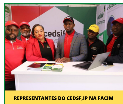
REPRESENTANTES DO CEDSIF,IP NA FACIM