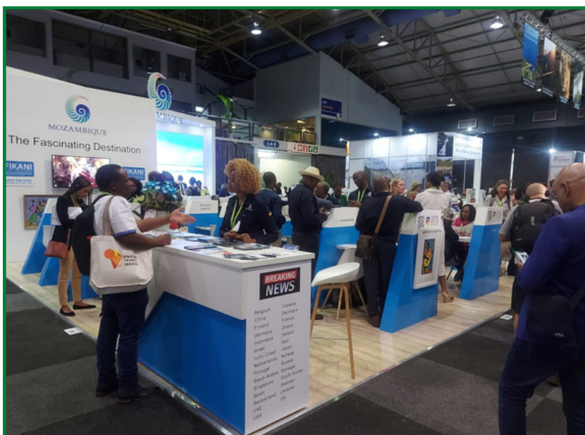
MOMENTO DE REGISTO DE ACESSO A FEIRA INDABA

A ocasião serviu também para interacção entre o CEDSIF,IP como provedor de serviços eletrónicos, com todos os participantes, em especial as Direcções Provinciais da Cultura e Turismo, presentes, para reafirmar a necessidade de uso do Módulo de Registo Nacional de Empreendimentos Turísticos (MRNT), para o registo de empreendimentos turísticos,