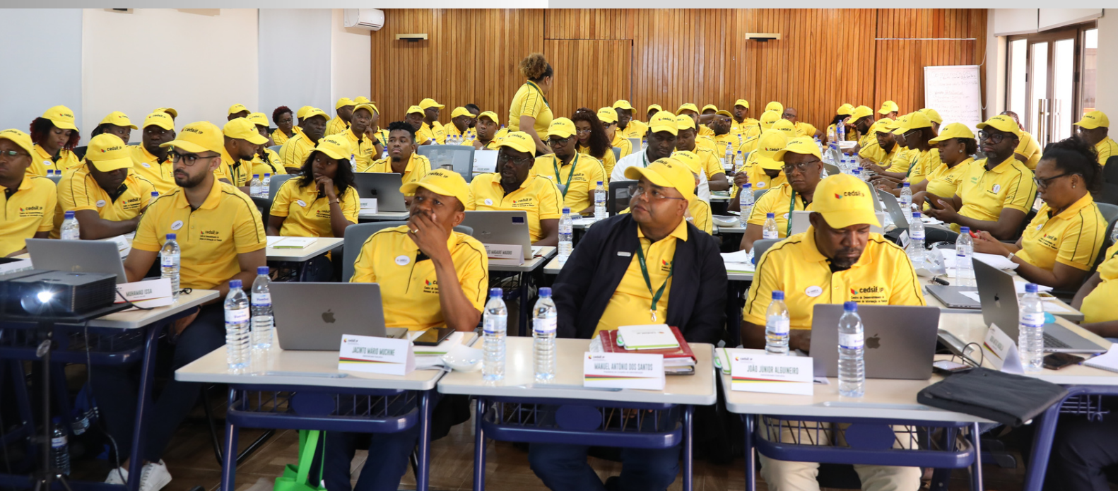
CEDSIF,IP EM REUNÃO ANUAL DA QUALIDADE PAG. 09