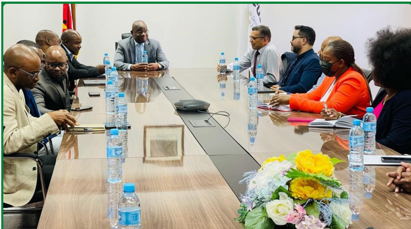
PROMENOR DA VISITA DO PGR AO CEDSIF,IP

O Centro de Desenvolvimento de Sistemas de Informação de Finanças (CEDSIF,IP) recebeu