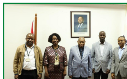
DELEGADA EMPOSSADA E DELEGADO SESSANTE COM O ENTÃO CONSELHO DE ADMINISTRAÇÃO DO CEDSIF, IP.

(SISTAFE) à todos órgãos e instituições do Estado existentes na Província, e bem como, a consolidação, monitoria, acompanhamento da plataforma e-SISTAFE e o processo de atendimento aos utilizadores. (X)